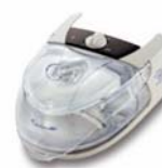
H4i rakataeki fyrir S8 kæfisvefnsvél