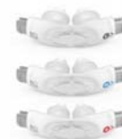
Nefpúðar fyrir Airfit P30i