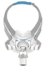
Andlitsgríma – AirFit F30 með QuietAir