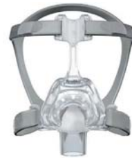
Nefgríma – Mirage FX