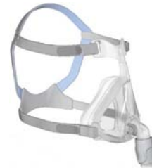
Andlitsgríma – Quattro Air