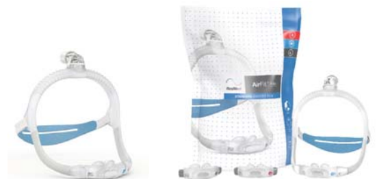
Nasagríma – AirFit P30i