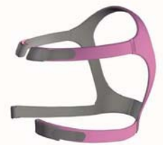
Höfuðband fyrir Mirage FX, fyrir konur