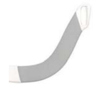
Hlífar fyrir höfuðband