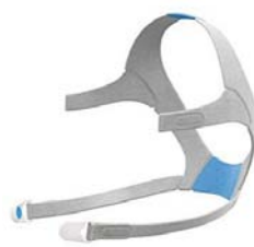
Höfuðband fyrir AirFit N20