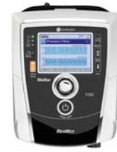
Stellar 150 bilevel öndunarvél