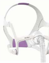
Nefgríma – AirFit N20 fyrir konur