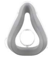
Púði fyrir viðkvæma húð – AirTouch F20*