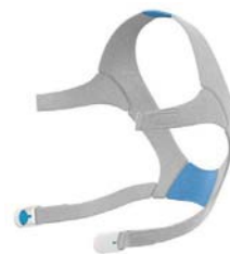
Höfuðband fyrir AirFit F20