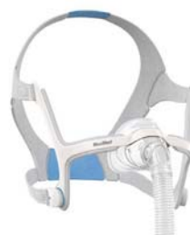
Nefgríma – AirFit N20