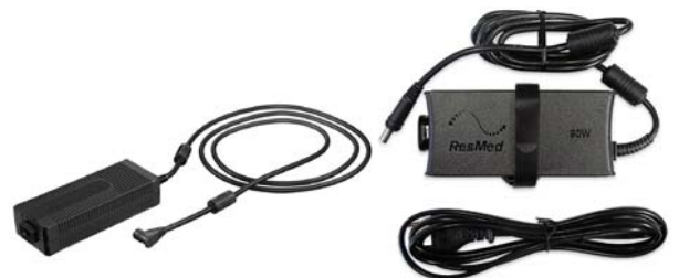
Aflgjafi fyrir S9 kæfisvefnsvél