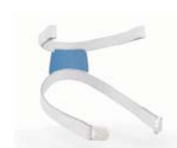
Höfuðband fyrir AirFit F30i