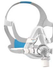
Andlitsgríma fyrir viðkvæma húð – AirTouch F20