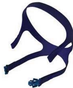
Höfuðband fyrir Mirage Quatro