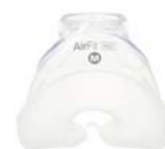
Púði fyrir AirFit N20