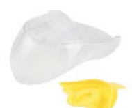
Lok og þéttihringur fyrir H4i