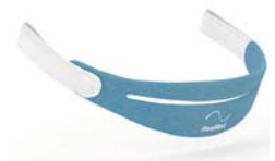
Höfuðband fyrir AirFit N30i