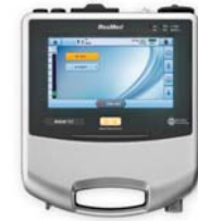
Astral 150 öndunarvél