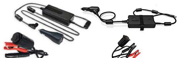
12V DC – DC aflgjafi fyrir S9 kæfisvefnsvél*

*Er ekki niðurgreitt af Sjúkratryggingum Íslands