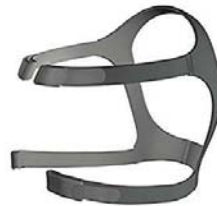
Höfuðband fyrir Mirage FX