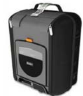
Stór ferðataska fyrir Astral