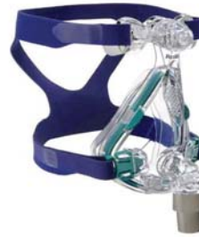
Andlitsgríma – Mirage Quatro