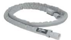
Hlíf fyrir Slimline barka