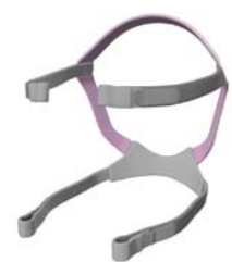
Höfuðband fyrir Quattro Air fyrir konur