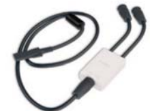
Snúra til að tengja saman tvö RPSII