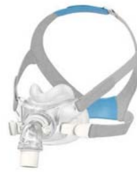
Andlitsgríma – AirFit F30