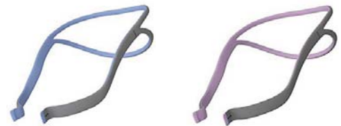
Höfuðband fyrir AirFit P10