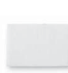
Ryksía fyrir kæfisvefnsvélar

Air 10 kæfisvefnsvélar = AirSense 10 og AirCurve