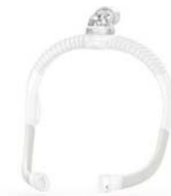
SpringFit höfuðgúmmí með tengi fyrir barka