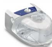
H4i rakatæki fyrir S8 kæfisvefnsvélar