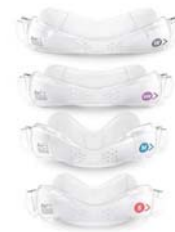
Nefstykki fyrir AirFit N30i