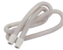
Grár barki (19mm)