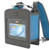
Lítill ferðataska fyrir Astral (Slimfit)