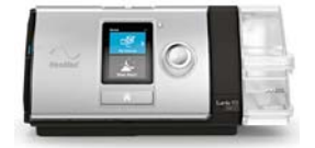
Lumis 150 VPAP kæfisvefnsvél