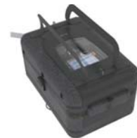
Ferðataska fyrir Stellar