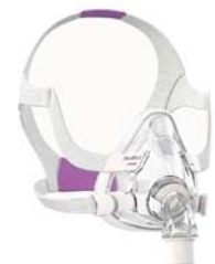
Andlitsgríma – AirFit F20 fyrir konur