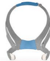
Höfuðband fyrir AirFit F30