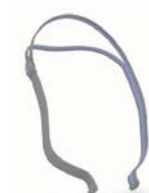
Höfuðband – AirFit N30