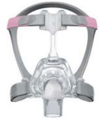
Nefgríma – Mirage FX fyrir konur