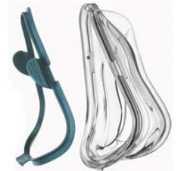
Púði og rammi fyrir Mirage Quatro