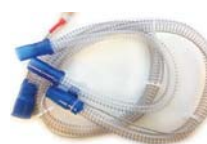
Einfaldur hitabarki fyrir D900