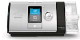
Lumis 100 VPAP kæfisvefnsvél