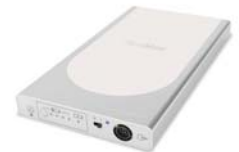
Ytri rafhlaða (RPSII)