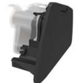
Hliðarlok fyrir Air 10