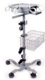
Hjólalandur fyrir Astral öndunarvél