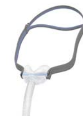
Nefgríma – AirFit N30