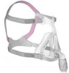
Andlitsgríma – Quattro Air fyrir konur