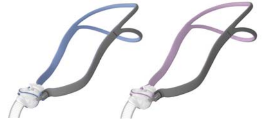
Nasagríma – AirFit P10