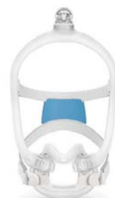
Andlitsgríma fyrir AirFit F30i

Stærð grímunnar fer eftir höfuðgúmmíinu.