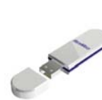
ResMed USB minnislykill