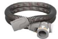
ClimateLine hitabarki fyrir Air kæfisvefnsvélar