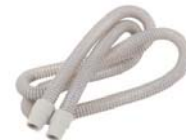
Grár barki (19mm)