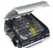
H5i rakatæki fyrir S9 kæfisvefnsvélar