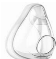
Púði fyrir AirFit F20