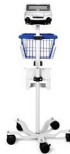
Hjólalandur fyrir Astral öndunarvél – NÝTT

*Panta þarf bæði hjólaland og plötu fyrir Astral öndunarvél