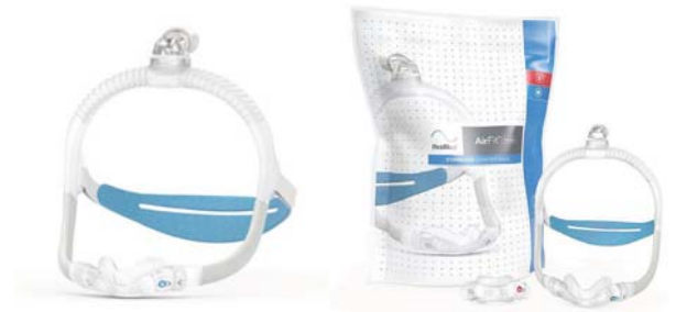
Nefgríma – AirFit N30i*