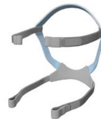
Höfuðband fyrir Quattro Air