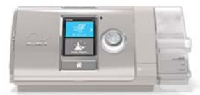
AirCurve 10 CS PaceWave