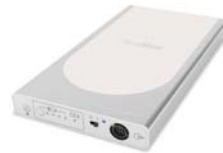
Ytri rafhlaða (RPSII)