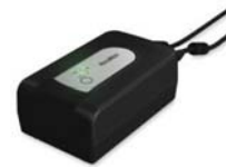
Ytri rafhlaða fyrir Astral