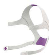
Höfuðband fyrir AirFit N20 fyrir konur