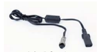
Snúra til að tengja Stellar við RPSII