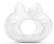
Púði fyrir AirFit F30