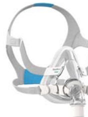
Andlitsgríma – AirFit F20