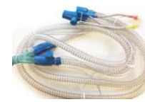
Tvöfaldur hitabarki fyrir D900