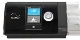
AirSense 10 AutoSet kæfisvefnsvél

Allar kæfisvefnsvélar eru afgreiddar með rakatæki og hitabarka.