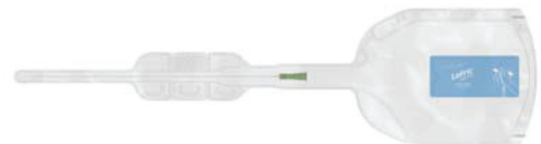
LoFric Hydro–kit 40 cm Tilbúinn til notkunar