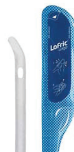
LoFric Origo Tiemann Tilbúinn til notkunar