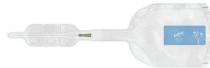
LoFric Hydro–kit 20 cm Tilbúinn til notkunar